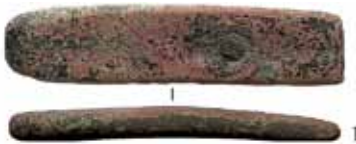
Рис. 3. Городище Кінські Води. Цеглини—«сухари» з бірюзовою поливою з глини (1) і кашину (2), кашинні плитки (3-4).

До статті М. В. Єльнікова «Пам'ятки часу Золотої Орди з будівельною кашинною керамікою з Полтавщини та Запоріжжя».