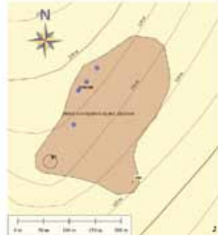
Рис. 2. Кантемирівський комплекс пам'яток пізньоримського часу. 1 – план; 2 – детальний план могильника. Програмна оболонка – «Global Mapper», основа – космознімок SAS Planet Yandex, основа гіпсометрії – SRTM.

До статті В. В. Шерстюка «Кантемирівський комплекс пам'яток: до розробки принципів пошуку ґрунтових могильників черняхівської культури».