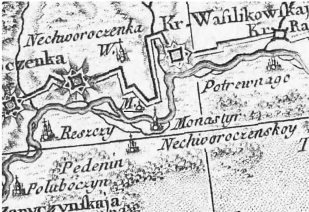
Рис. 2. Фрагмент карти Річчі Заноні кін. XVIII ст. «Karta Granic Polski, u Rossyi, Zawierająca Część Południową Ukrainy, u Przeciąg Dniepru, Zaczawszy od Kiiowa, aż do Samary», де добре видно дві локації з позначкою монастир (на лівому і на правому березі р. Оріль)

Низка картографічних джерел доводить, що місцевість поорілля навколо Нехворощі мала доволі виразні особливості, які можна реконструювати і доволі точно визначити (картографія 1740, 1821, 1878, 1927, 1930 рр.). Місцевість між лівим берегом р. Оріль та каналом Дніпро – Донбас насичена старицями, заболоченими озерами та заливними луками. Територія колишнього монастирського комплексу доволі точно локалізується на південно-східному боці V-подібної за формою стариці на місці наявних насипів валів (до 3 м заввишки). Єдина подібна за формою стариця з позначкою монастиря на південно-східному березі зображена на плані містечка Нехвороща 1740 р. (РДВІА, ф. 349, оп. 19, № 4413), опублікованій В. Ленченком у 2008 р. [6, с. 289]. Монастир, як і сучасні залишки, показаний на перешийку між V-подібною старицею (на низці мап саме це Святе озеро) та значно меншим за розміром озерцем з північного сходу. Єдина відмінність у тому, що на мапі 1740 р. монастир має близьку до квадрату форму, а сучасні решки з валами мають прямокутну видовжену форму. З урахуванням вивчених джерел