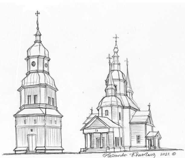
Рис. 3. Гіпотетична реконструкція зовнішнього вигляду Свято-Успенського храму та окремо розташованої дзвіниці. Вид із північно-східного боку (мал. О. Харлана, 2022 р.)

Наприкінці 1840–1850-х рр. продовжує формуватися Успенська площа, на ній виникає потужна кам'яна домінанта. Нова містобудівна структура видозмінювала первинні особливості забудови, вирівнювала давні напрямки і лінії шляхового сполучення, ховала в цегляні труби колишні річки. Однак через деякі обставини вона певною мірою підкреслювала той первинний код місцевості, його унікальні риси і складові, що карбувалися в нових матеріалах, нових знаннях і нових образах.