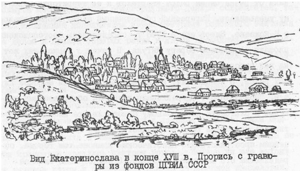
Рис. 1. Прорис панорами забудови слободи Половиці з храмом і дзвіницею (за матеріалами В. Тимофійенка)

Як вказує більшість джерел, Сокільський Преображенський чоловічий монастир на горі Духовій, при річці Ворскла, знаходився в містечку Сокілки 1 Кобеляцького повіту Полтавської єпархії. Існував протягом 72 років. Заснування скиту мешканцем містечка Сокільська (Сокілки) Микитою Федоровичем (у подальшому монаха обителі Никодима) під подошвою гори Духової в дарчому записі вказується 1714 р., а затверджуючий її універсал гетьмана Івана Скоропадського сягає 1717 р. На початку свого існування скит підпорядковувався Полтавському Хрестовоздвиженському монастирю. В 1723 р. в реєстрі Задніпровських монастирів Київської єпархії він значився як «Сокульська пустинька». Відомо, що в